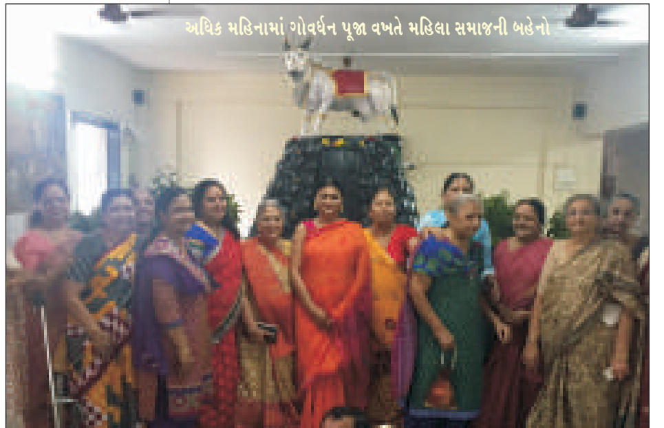
અધિક મહિનામાં ગોવર્ધન પૂજા વખતે મહિલા સમાજની બહેનો