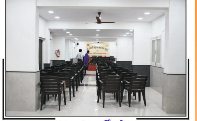
લગ્ન / પાર્ટી હોલ