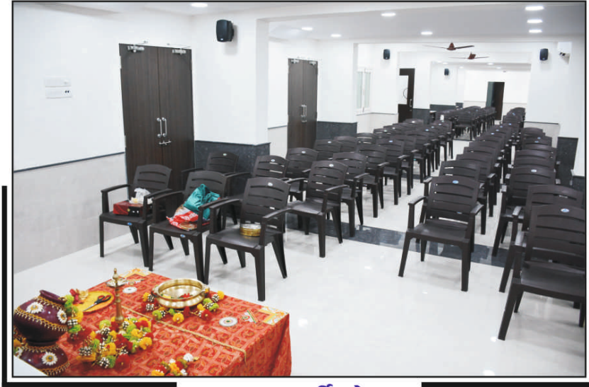
લગ્ન / પાર્ટી હોલ